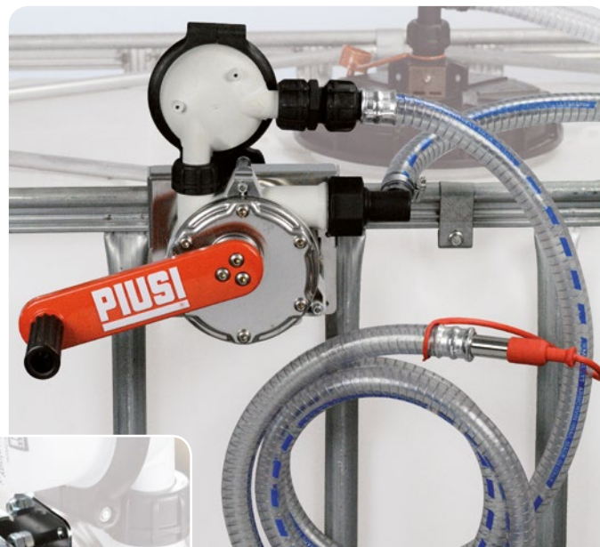
With filter version