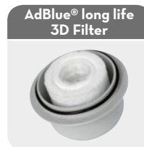
AdBlue® long life 3D Filter