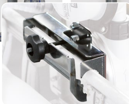
Steel support IBC braket