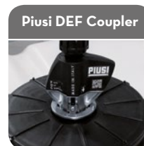
Piusi DEF Coupler