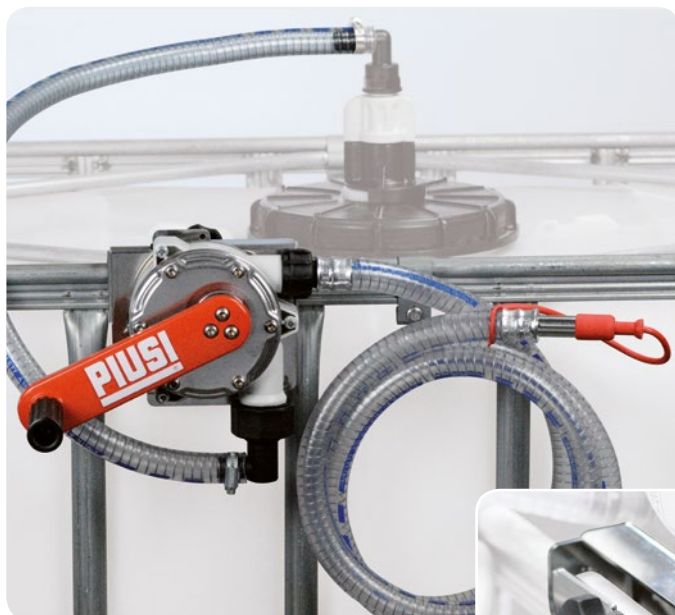
Without filter version