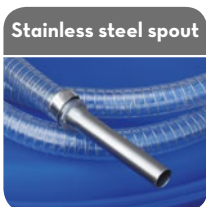
Stainless steel spout