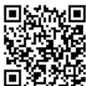
PIUSI HAND PUMP VIDEO