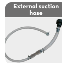
External suction hose

Code F20189000 56x4 buttress 1" BSP Code F20190000 2" buttress 1" BSP Code F20257000 2" BSP 1" BSP Code F20258000 2" 70x6 1" BSP (with drum adapter)