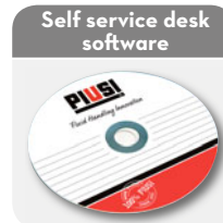
See "Fluid monitoring" section