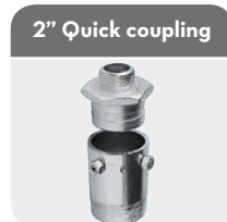
2" Quick coupling