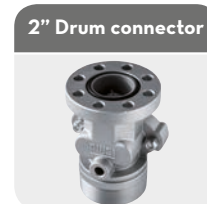
2" Drum connector