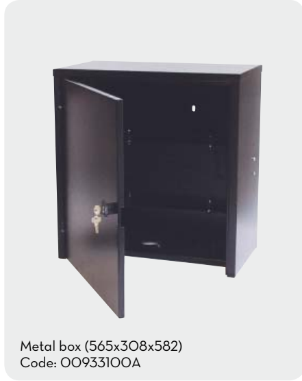
Metal box (565x308x582) Code: 00933100A