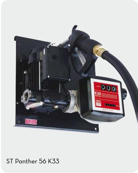
ST Panther 56 K33